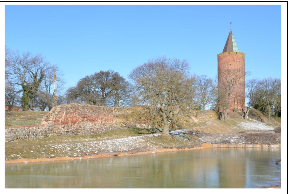
Foto: Gåsetårn m. vandfyldt voldgrav efter 400 år. Marts 2013 - John Holmer