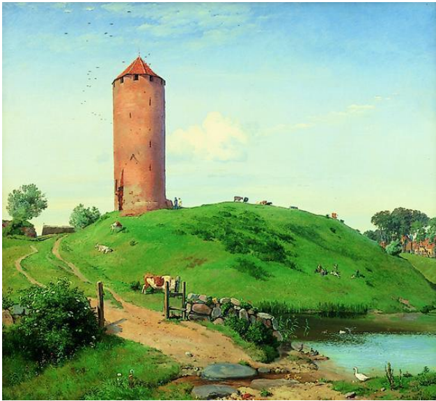
J. Th. Lundbye: Gåsetårnet. Statens Museum for Kunst.

Første arrangement i 2013 i Viemose Forsamling: