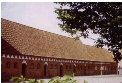
Boderne på Sct. Peders Kirkeplads

Næstved Museum er et statsanerkendt, kulturhistorisk museum. I samarbejde med de øvrige museer og Kulturarvsstyrelsen arbejder Næstved Museum med lokale aspekter af Danmarks kulturarv indenfor alle perioder til i dag.