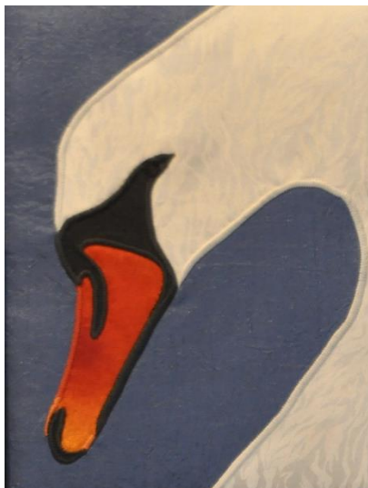
Kunstner: Bodil Rasmussen

Bodil Rasmussen syr med stor grafisk sans de fineste fuglemotiver.